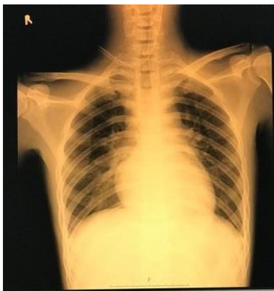
Gambar 1. Rontgen Thoraks

Pemeriksaan laboratorium didapatkan Hb : 7,9 gr/dL, eritrosit : 3,1 juta/uL (menurun), hematokrit : 25%(menurun,) leukosit : 4.770 /uL, trombosit : 177.000, neutrofil segmen : 93% (meningkat), LED : 78 mm/jam (meningkat). Natrium : 126 mmol/L (menurun), Kalium : 7,1 mg/dl (menurun). Pemeriksaan rontgen thorax didapatkan gambaran corakan bronkovaskular meningkat dan konsolidasi di hemithorax bilateral.